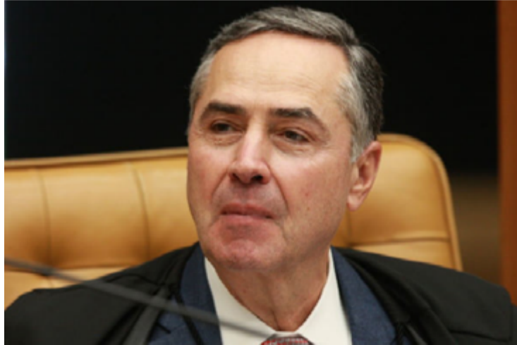
Luis Roberto Barroso

Na nota assinada por Barroso, sem citar nominalmente Musk, o presidente do Supremo diz que é público e notório que “travou-se recentemente no Brasil uma luta de vida e morte pelo Estado democrático de Direito e contra um golpe de Estado, que está sob investigação