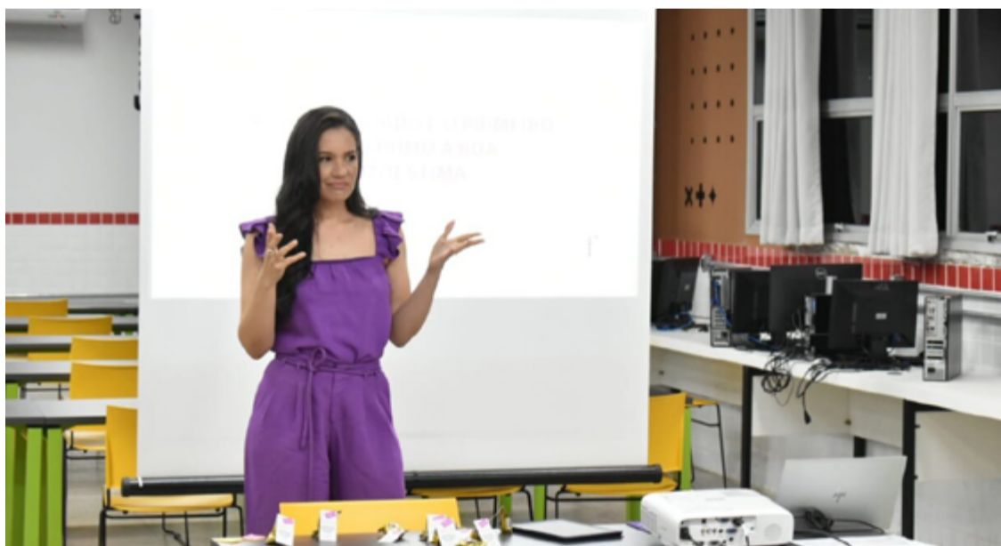
Goianas S.A seleciona 61 projetos de mulheres empreendedoras

“Espero aprender sobre empreendedorismo, gestão de negócios e finanças relacionadas à área clínica”, anseia. Ela, que veio de São Luís, no Maranhão, e encontrou em