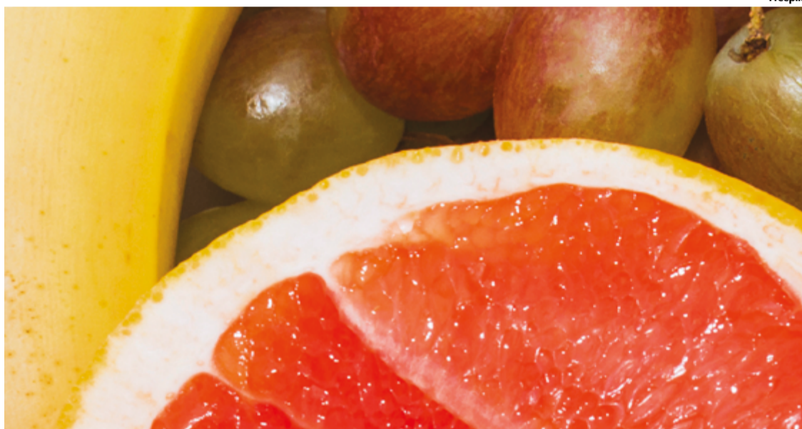
Frutas na dieta diária, ao menos três porções por dia, garantem a ingestão de fibras, vitaminas e minerais essenciais

mastigação lenta e apreciativa contribui para uma alimentação mais equilibrada", reforça.