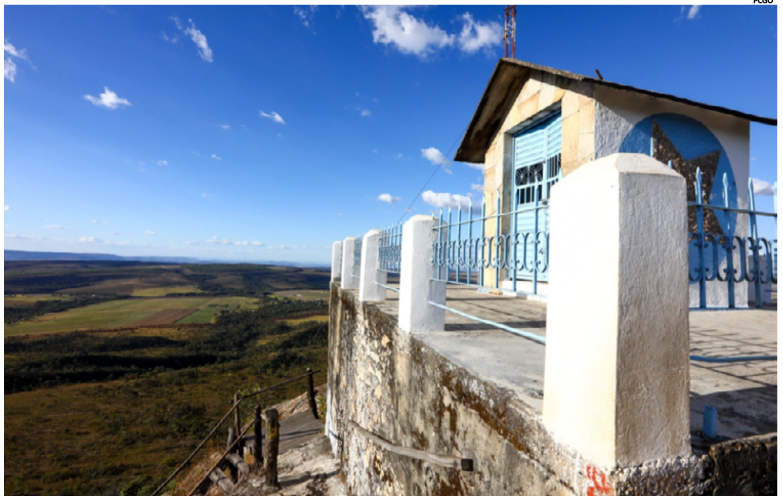
No topo do morro mais alto da região, com mais de 1300 metros de altitude, é possível ver os arredores de Pirenópolis e do Parque Estadual da Serra dos Pirineus.

Os interessados em participar do conselho devem encaminhar um ofício para o endereço de e-mail pep.meioambiente@goias.gov.br . Após o