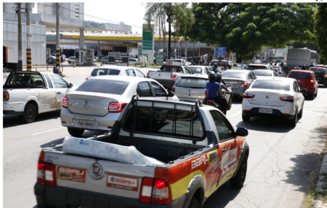
Este ano, os donos de veículos com placa final 1 e 2 puderam parcelar o IPVA em nove vezes, de janeiro a setembro

Para a placa de final 1, o prazo para quitar o imposto vence na segunda-feira, 8. Nos próximos dias seguem as datas para finais 2 (9/4); 3 (10/4), 4 (11/4), 5 (12/4), 6 (15/4), 7 (16/4), 8 (17/4), 9 (18/4) e final 0 (19/4). A emissão do boleto deve ser feita pelo próprio contribuinte no site do Departamento Estadual de Trânsito de Goiás (Detran/GO) ou pelo