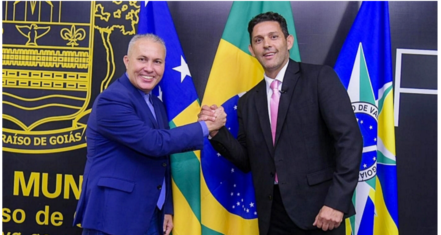
Este movimento político representa mais uma baixa significativa no grupo de apoio ao prefeito Pábio Mossoró, que já enfrentava desafios para garantir a continuidade de seu projeto político na cidade

A gestão Mossoró enfrenta atualmente uma crescente impopularidade, principalmente devido à falta de investimen-