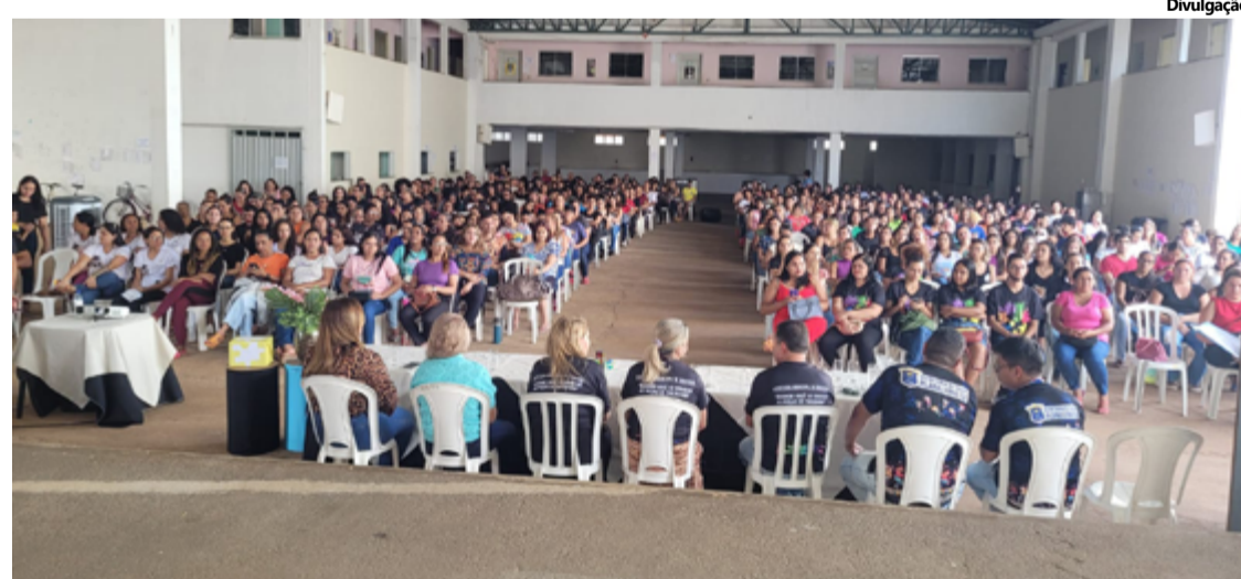
Palestra sobre crianças com transtorno do espectro autista em Planaltina de Goiás

“O evento superou todas as expectativas. Falei para professores, diretores, educado-