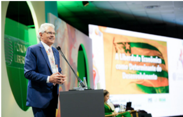
Ronaldo Caiado encerra rodada de painéis do 37º Fórum da Liberdade, maior evento da América Latina para debate de temas da política, economia e negócios

Caiado foi o palestrante principal no 37º Fórum da Liberdade e encerrou a rodada de painéis do evento, tido como o maior da América Latina