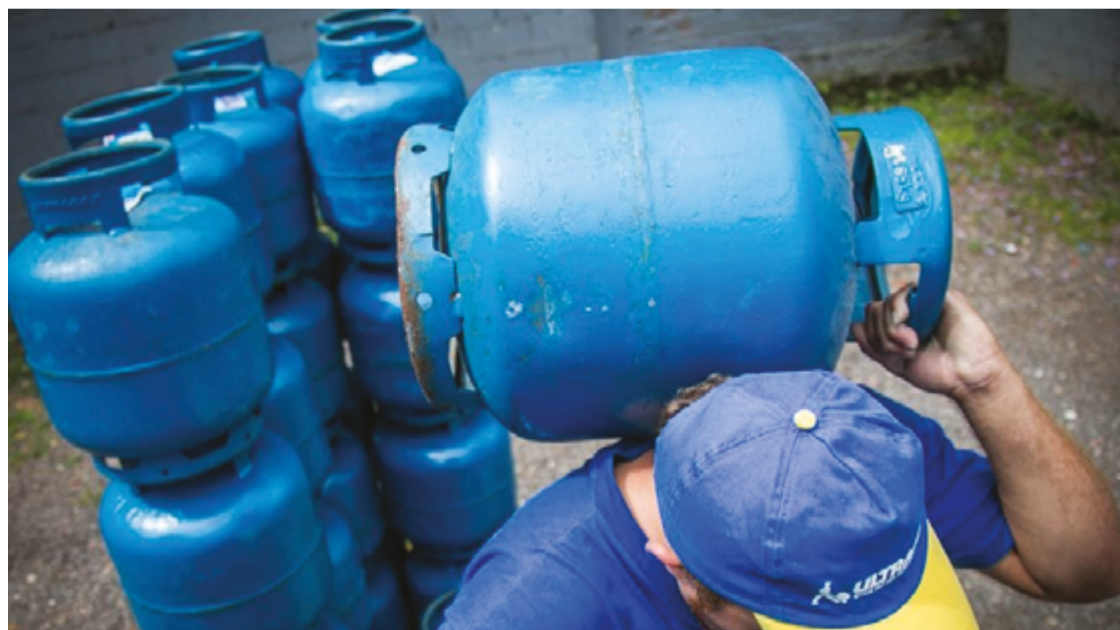
Levantamento feito pelo Procon Municipal lista os menores e maiores preços dos itens em estabelecimentos da cidade

A pesquisa também avaliou os valores dos cilindros de 20Kg e 45Kg e da água mineral de 20 litros. O primeiro item está com oscilação de 118%, o que levanta um alerta aos consumidores na hora da compra, já que ele tem sido vendido en-