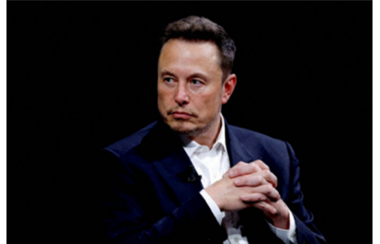
Empresário Elon Musk

O ministro deu as declarações durante um evento com defensores públicos em Curitiba. Ele também lembrou do impacto das plataformas na eleição de 2018, vencida por Jair Bolsonaro, e disse que “foi o primeiro assombro que veio do ponto de vista da autorização das redes sociais”.