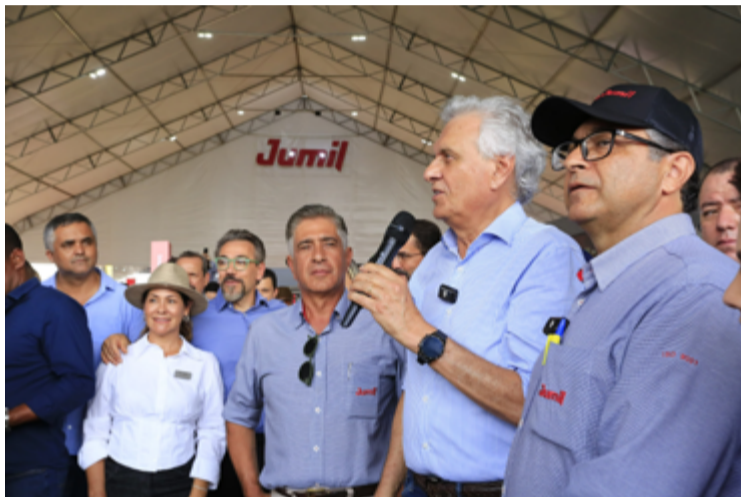
Governador Ronaldo Caiado visita estandes na Tecnoshow Comigo, em Rio Verde

Para a Tecnoshow, o Governo de Goiás montou um grande estande com serviços da Secretaria de Agricultura, Pecuária e Abastecimento (Seapa) e suas jurisdições; Secretaria de Meio Ambiente e Desenvolvimento Sustentável (Semad); Agência de Fomento do Estado (GoiásFomento); e Secretaria de Ciência, Tecnologia e Inovação (Secti). "Isto aqui é uma escola onde todo ano o produtor rural vem, permanece por cinco dias, e