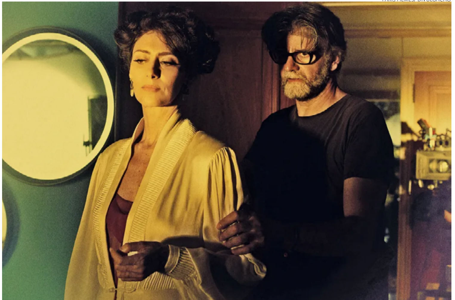
Atriz e diretor no set: filme começou a ser rodado na década passada e contou com árduo trabalho para transpor romance à linguagem do cinema