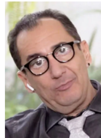
Senador Jorge Kajuru