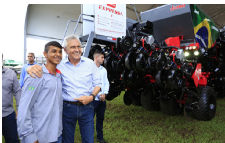
Governador Ronaldo Caiado participa e conhece stands na abertura da Tecnoshow Comigo, em Rio Verde

Segundo Caiado, o aumento da produção traz a necessidade de “adequar as rodovias à passagem de bitrens e carretas cada vez maiores”. No caso da GO-174, o valor estimado da obra, já em fase de licitação, é de mais de R$ 80 milhões, o empreendimento facilita o acesso à região onde é realizada anualmente a feira. Na GO-210, a substituição do asfalto atual pelo pavimento rígido (concreto) está em andamento e equivale a um aporte de mais de R$ 50 milhões. A terceira intervenção que será realizada na região de Rio Verde é a pavimen-