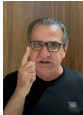
Pastor Silas Malafaia

● Portanto, se um homem tem fé, ele tem que ter esperança; porque sem fé não pode haver qualquer esperança. 43 E novamente, eis que vos digo que ele não pode ter fé nem esperança sem que seja manso e humilde de coração. - Morôni 7:42-43