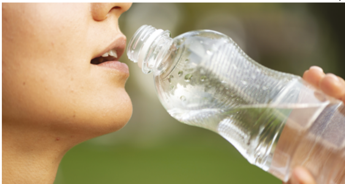
Especialista recomenda ingestão mínima de dois litros de líquidos por dia, seja água, água de coco e sucos naturais

A especialista destaca a importância de desacelerar o ritmo durante as refeições, evitando a ingestão rápida que pode levar ao excesso de comida e sensação de inchaço. "A