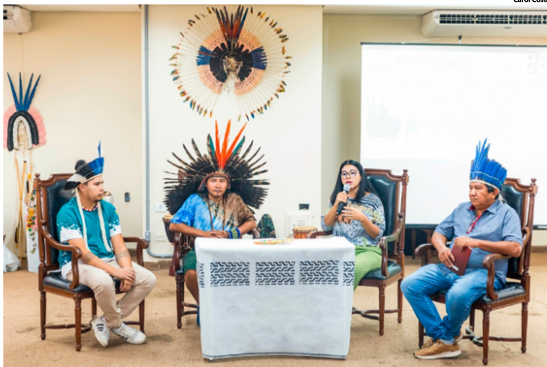
Encontro reuniu líderes de diferentes etnias e contou com apresentações musicais, exposição de artes e mostra de adornos corporais