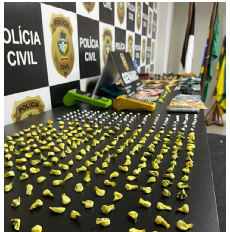
Em alguns locais foram apreendidas centenas de porções de entorpecentes embalados e prontos para a venda

Todos os conduzidos ao GENARC tiveram oportunidade de esclarecimento, sendo que agora encontram-se recolhidos e responderão pelo tráfico e associação para o tráfico de drogas, se condenados as penas, caso somadas, ultrapassam 20 anos de reclusão. Vale ressaltar que, a investigação prossegue para fins de levantamento patrimonial dos bens dos envolvidos para fins de perdimento do que for proveniente do crime.